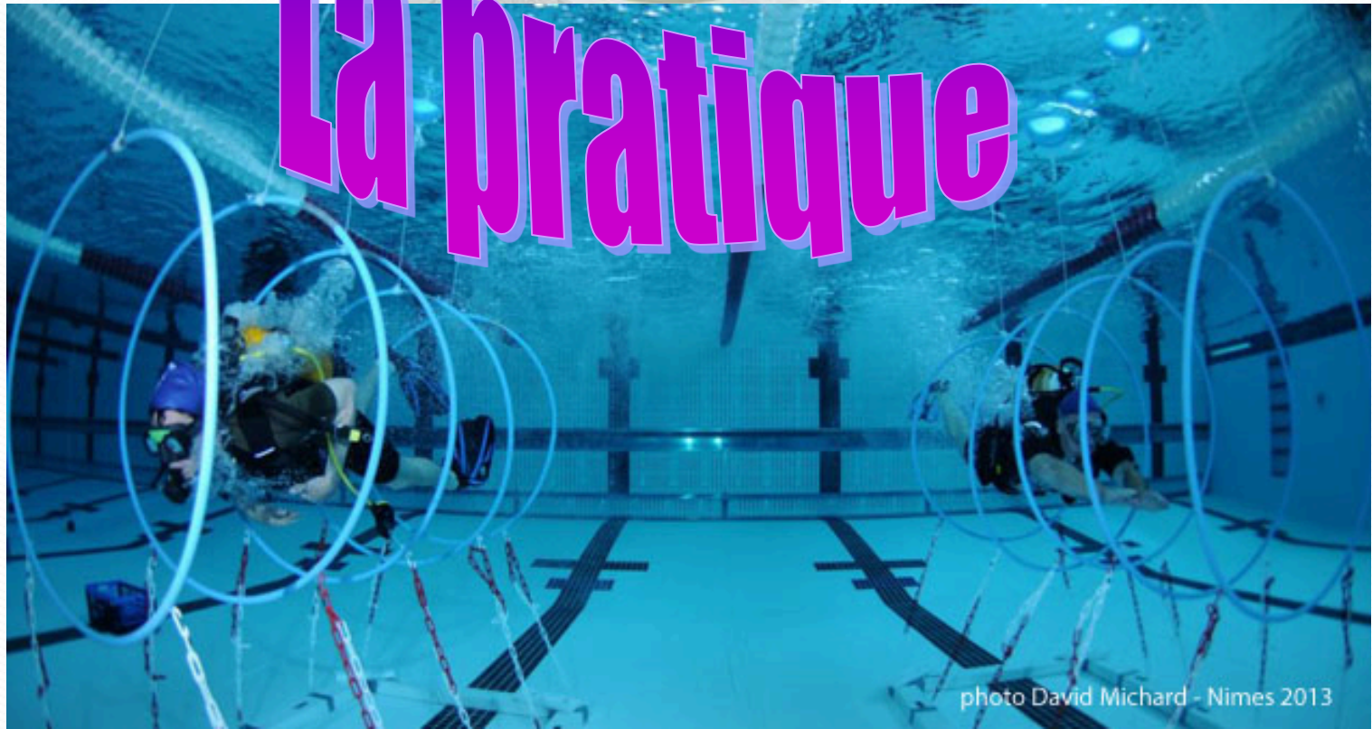
Nimes 2013